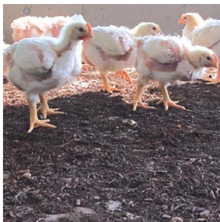
La litière pour volailles lit naturel® dans le poulailler. On peut observer la couleur foncée et la structure hétérogène avec des morceaux de bois grossiers et une proportion de particules fines relativement importante.

Quatre procédés ont été testés dans le cadre d'un essai à Aviforum en mars et avril 2022: deux procédés avec lit naturel® litière pour volailles (0,85 kg/m 2 resp. 0,70 kg/m 2 ), un avec des copeaux de bois