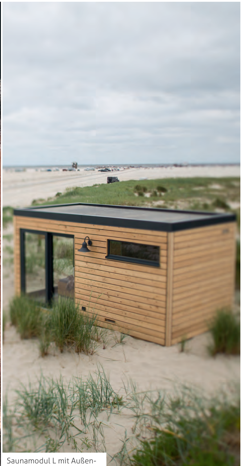
Saunamodul L mit Außenverkleidung aus Lärche